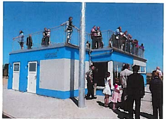
Blick auf Flughafenbaustelle

In Anwesenheit von Wirtschaftsminister Dieter Posch wurde das Informationszentrum an der Baustelle für den neuen Verkehrsflughafen Kassel-Calden Anfang Juni 2011 eröffnet. Darin können sich Interessierte über den Baufortschritt informieren. Von der Dachterrasse des Infopoints hat man einen Rundumblick über die gesamte Baustelle, die zu einer der größten Erdbaustellen Europas zählt. Im Inneren des Besucherzentrums steht ein Modell des neuen Flughafens und es gibt Fotos von Computeranimationen, die zeigen, wie der Flughafen später aussehen wird. Parkplätze für die Besucher wurden direkt neben dem Infopoint errichtet.