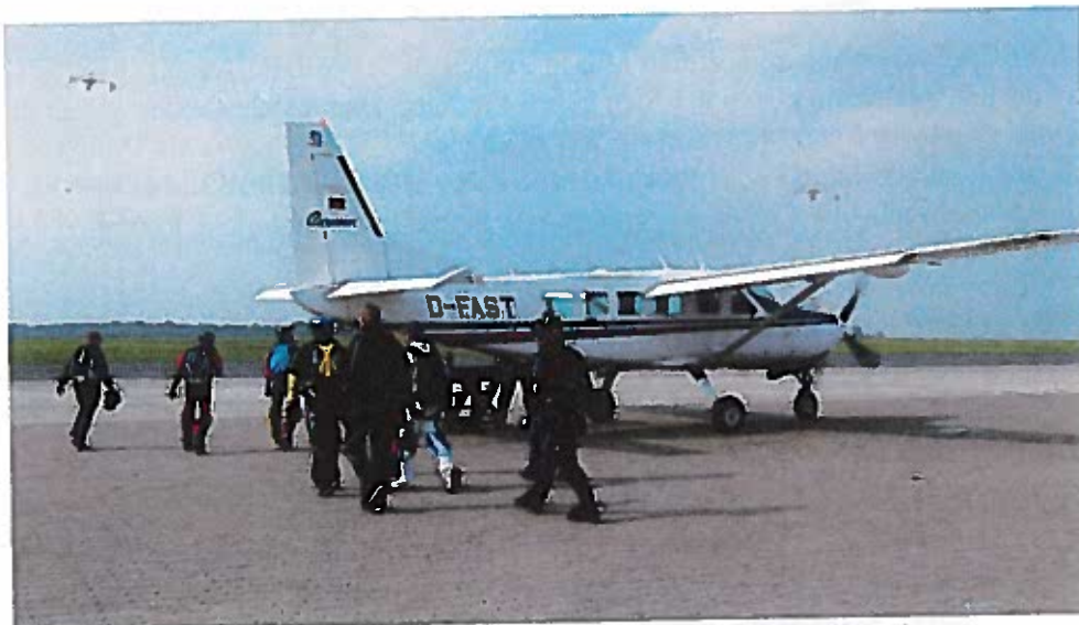
Teilnehmer der Deutschen Meisterschaften im Fallschirmspringen

Vom 31.8. bis 4.9.2011 wurden die Deutschen Meisterschaften im Fallschirmspringen auf dem Verkehrslandeplatz Kassel-Calden ausgetragen. Organisiert wurde die Meisterschaft von der Fallschirmspringschule Aero Fallschirmsport und dem Fallschirmsport Zentrum Kassel. 180 Sportler gingen bei der Meisterschaft an den Start und lockten mit ihren Luftkünsten auch reichlich Publikum an. In den Disziplinen: Freifall-Formationsspringen in Vierer- und Achterteams, Artistik sowie Kappenrelativ, also das Fliegen von Formationen am geöffneten Schirm, kämpften die