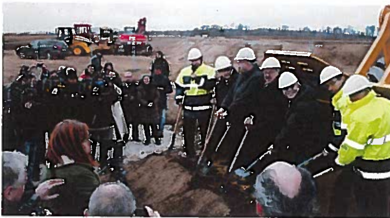
Erster Spatenstich Neubau Flughafen

Flughafen neue Arbeitsplätze, stärkt die Wettbewerbsfähigkeit Nordhessens und wird weitere Investitionsentscheidungen auslösen. Die Eröffnung des Regionalflughafens Kassel-Calden ist für das Frühjahr 2013 vorgesehen.