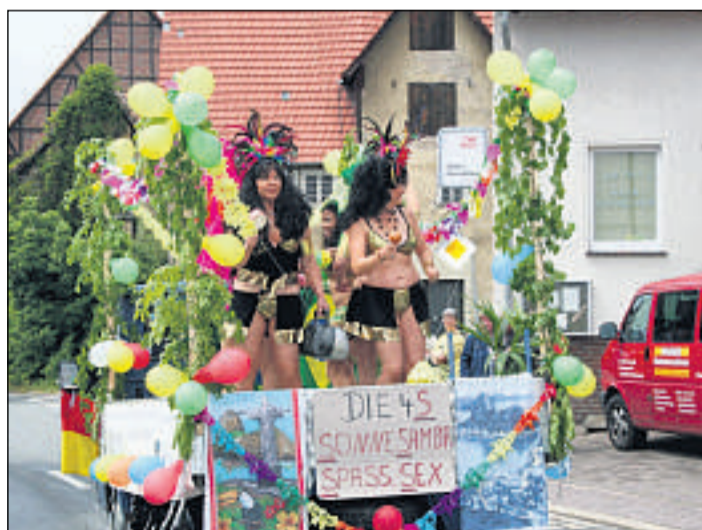
Schön anzusehen: Fußgruppen und Motivwagen werden beim Festzug durch das Dorf zu sehen sein.

Wer am kommenden Wochenende keine Zeit hat, der wird die Altenhasunger Kir-